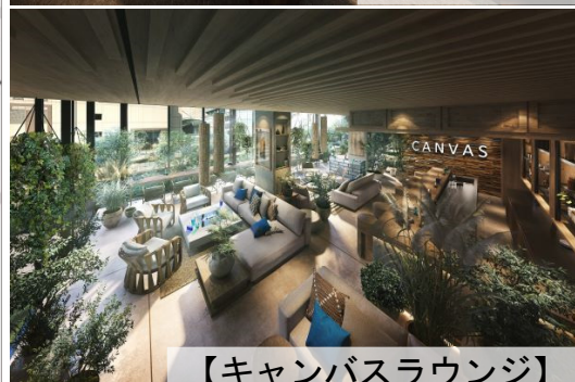
【キャンバスラウンジ】