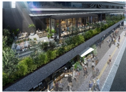
【緑化バルコニーと公開空地のピロティ】