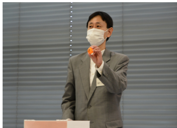
抽選人による厳正な抽選