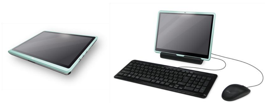
薄くて軽い約880gのタブレット型端末 (幅278mm×奥行228mm×厚さ15mm)

大切なお客さまの情報はシステムセンターで一元管理し端末内には保持しません。また、端末内蔵ディスクは暗号化により強固なセキュリティを実現しました。