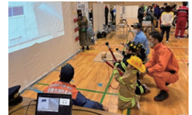
「こどもシゴト博®」の様子