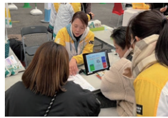
明治安田の健康チェック

(注)シャレン!(社会連携活動)は、Jリーグ・Jクラブが3者以上と協働して社会課題等に取り組む活動です