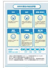
同業種の平均値との 比較(イメージ)