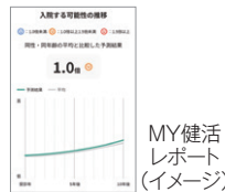
MY健活 レポート (イメージ)

2025年12月にがん専門病院と連携し、がん専門医に無料で相談できるサービス等を拡充しました。がん検診から治療後の生活までの不安に寄り添い、専門機関と連携したサービスをご用意しています。