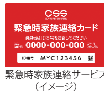
緊急時家族連絡サービス (イメージ)