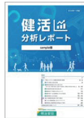
健活分析レポート

※1 コラボヘルスとは、健康保険組合等の保険者と事業者が協力して従業員・所属員の健康づくりを効率的・効果的に実行することです