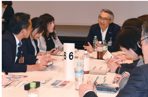
社長と従業員が討議する様子

また、お客さま志向の取組状況を統括するお客さま志向統括部を設置し、「お客さま志向取組計画」の推進等を通じてPDCAサイクルを推進しています。