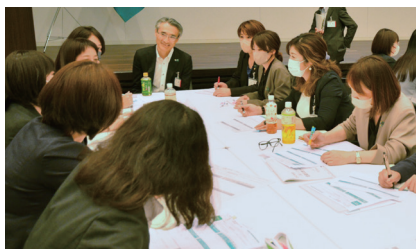
▲「Kizuna運動」研修会で社長と従業員が討議する様子

また、お客さま志向の取組状況を統括するお客さま志向統括部を設置し、「お客さま志向取組計画」の推進等を通じてPDCAサイクルを推進しています。