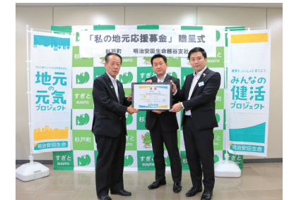
「私の地元応援募金」の贈呈式の様子