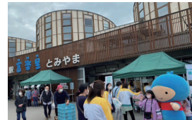
「道の駅富楽里とみやま」(千葉県)で開催した血管年齢測定会の様子