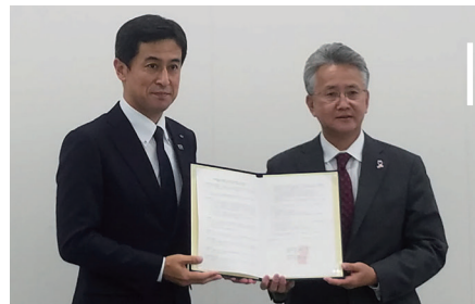
協会けんぽ宮崎支部との連携協定締結式の様子