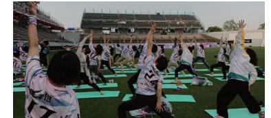
Jリーグサガン鳥栖の選手とのアスリートヨガ教室の様子