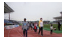
徳島支社のイベントの様子

地域のみなさまが地元のJクラブ選手等と楽しみながら一緒に歩くことで、健康づくりを応援するウォーキングイベントを全国で展開しています。