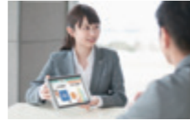
MY健活レポートご案内の様子

MY健活レポートは、「ベストスタイル 健康キャッシュバック」ご加入のお客さま、「MY健活レポート認知症保険版」は「認知症ケア」「いまから認知症保険」にご加入のお客さま専用のサービスです。ご提出いただいた健康診断結果をもとにお客さまごとの健康増進に向けたアドバイスや、ビッグデータを活用した疾病リスク予測等の情報を提供します。