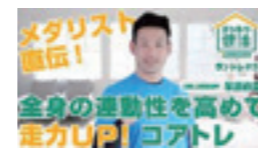
塚原直貴さん(元陸上競技選手)ご出演の動画

ご自宅など「屋内」での健康づくりをサポートする取り組みとして「おうちで健活」を展開しています。ヨガや親子で楽しめるストレッチ等、バリエーション豊かな動画を「みんなの健活プロジェクト」専用サイトや、明治安田生命公式YouTubeチャンネルで配信しています。