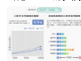
入院リスク予測(イメージ)

「みんなの健活プロジェクト」の一環として、病気の予防・早期発見や重症化予防に役立つさまざまなサービスをご用意しています。