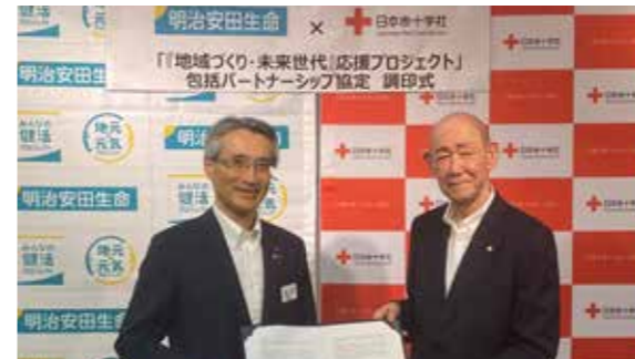
日本赤十字社との「地域づくり・未来世代」応援プロジェクトの展開に関する包括パートナーシップ協定の締結式

日本赤十字社の協力のもと、当社が両社に関連する団体・民間企業等との幅広い連携・協働や、コンテンツ活用等のコーディネーターとなり、地域社会の活性化や課題解決に向けた両社のノウハウ等を融合のうえ展開するプロジェクトです。具体的には、各地域でさまざまな取り組みを展開している日本赤十字社と当社の連携による健康・福祉・介護・教育等の「ソーシャル・インクルージョン」に関する支援のほか、将来的に安心して暮らせる環境維持等への取り組みを進めてまいります。