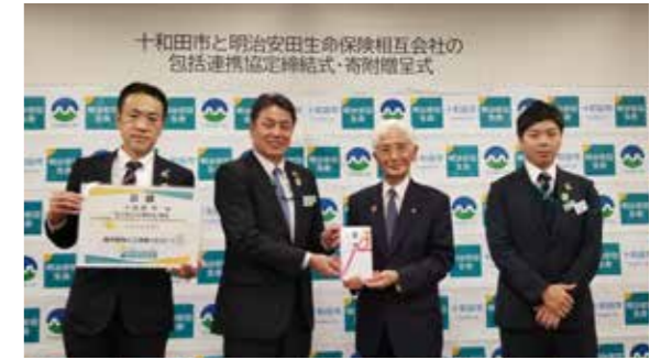
「私の地元応援募金」の贈呈式(八戸支社)

当社の営業拠点が所在する全国の自治体等に対して、従業員が出身地などのゆかりある地域を指定して行なう任意の募金に、会社拠出を上乗せして寄付を行なう活動です。