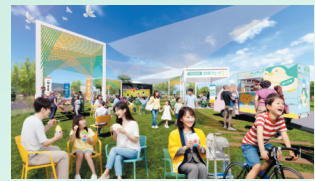
明治安田「健活パーク」イメージ