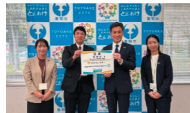
「私の地元応援募金」贈呈式(名古屋南支社)

3 地域共創withホームタウン >>> 当社・自治体・企業と一緒に、各地域の課題解決に 取り組んでいます