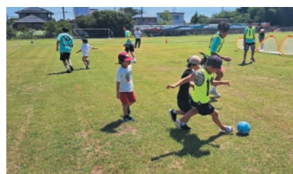
芝生でのサッカーイベント(鳥取支社)