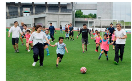
小学生向けサッカー教室の様子(高松支社)