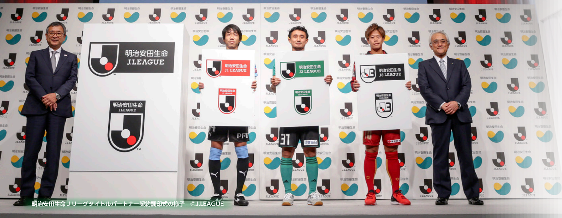
明治安田生命 Jリーグタイトルパートナー契約調印式の様子