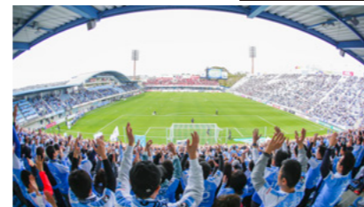
ジュビロ磐田の試合の様子(ヤマハスタジアム)