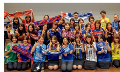
「明治安田生命Jリーグ女子倶楽部」の活動の様子

当社女性従業員が中心となり、女性ならではの視点でJリーグを盛り上げようと、全国各組織で「明治安田生命Jリーグ女子倶楽部」を結成しています。試合観戦だけでなく、サッカーへの興味・関心を高め応援の輪を広げていくために、さまざまな活動に取り組んでいます。