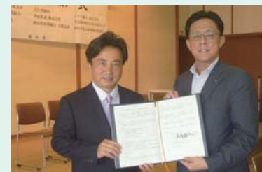
岡山県総社市での協定締結の様子

MYライフプランアドバイザーが日々のお客さま訪問活動を通じて、お子さまや高齢者等の様子に変わったことや気付いたことがあれば、警察署・地方自治体の窓口等に連絡し、不測の事態を未然に防ぎ、地域の安心・安全を見守ります。この活動は、警察庁にご協力いただくとともに、地方自治体と協力協定書の締結や協力事業者登録等を通じた連携を強化し、地域に密着した活動として推進しています。