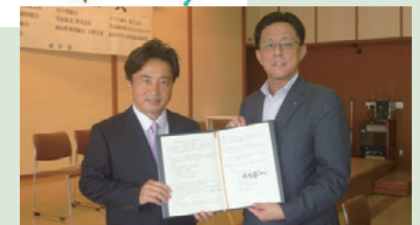
岡山県総社市での協定締結式の様子