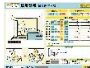
専門知識が必要な住宅改修も、イラストで確認しながらプランづくりができます。