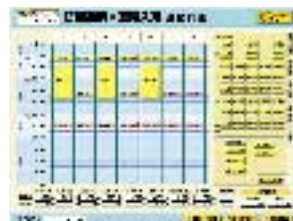
各種サービスを選択すると、それにあつた計画をわかりやすく表示。サービスに応じた利用料もひと目で確認できます。

明治生命が独自開発したケアプラン作成支援システム「ケアマネくん」を使って、最適なケアプランを短時間で策定し、わかりやすくご説明します。