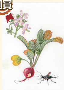
ラディッシュ 粕谷 修様