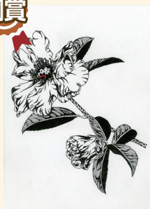
さざんか 高橋 宙花様