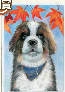
紅葉の下で 菅原 みさき様