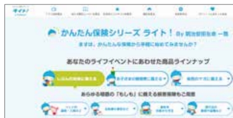
当社公式ホームページ「かんたん保険シリーズ ライト! By明治安田生命」

商品を検討するにあたり、より詳細な説明や提案をご希望されるお客さま向けには、当社公式ホームページ上で資料のご請求等を行なっていたいただいたお客さまに対して、営業職員(MYライフプランアドバイザー等)・「明治安田のほけんショップ」の担当者等による対面・非対面でのコンサルティングを案内する取組みも展開しています。今後もテクノロジーの進化に応じた各種コンテンツの拡充や、手続きの取扱い範囲拡大等、お客さまの利便性向上や理解促進に資する取組みを進めていきます。