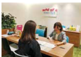
明治安田のほけんショップ 船橋

※なお、当社グループ会社の明治安田保険サービス(株)では、当社・他社商品を取り扱う「ほけんポート」を運営