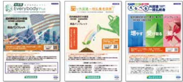
外貨建一時払終身保険「外貨建・エブリバディプラス」パンフレット 外貨建一時払養老保険「外貨建・一時払養老保険」パンフレット 外貨建一時払終身保険「えらべる外貨建一時払終身」パンフレット