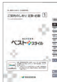
ご契約のしおり 定款・約款 ベストスタイル

紙資源の使用削減による省資源化推進を目的の一つとして、当社の主力生命保険商品において、約款部分のCD-ROM化を実施してきました。また、主力生命保険商品である「ベストスタイル」を含め、平成27年9月には、営業職員が取り扱う新規ご契約分のすべての商品について約款部分をWEB化し、省資源化等の取組みをいっそう推進しています。