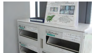
リサイクルボックス

本社がある明治安田生命ビルの各階に専用リサイクルボックスを設置するなど、廃棄物の分別回収やリサイクルに積極的に取り組んでおり、平成28年度のリサイクル率は89.0%となっています。