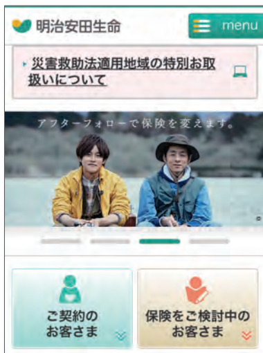
スマートフォン専用サイト

引き続き、インターネットチャネルの活用をはじめとしたデジタル領域での調査・研究を通じ、お客さま利便性向上に資する取組みを進めていきます。