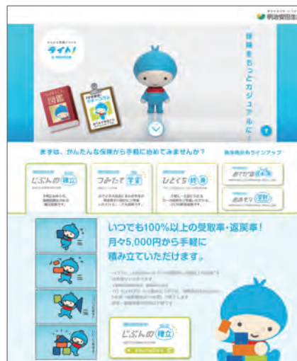
かんたん保険シリーズ ライト！ By明治安田生命