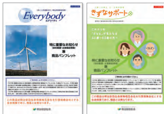
一時払終身保険 「エブリバディ」