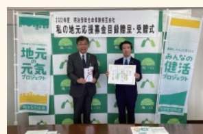
「私の地元応援募金」の贈呈式