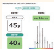
MY健活レポート画面のイメージ (健康年齢®)※2