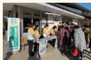
道の駅でのイベント