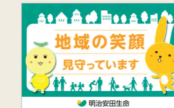
従業員が常時携帯するカード

全国のMYライフプランアドバイザーが、日々のお客さま訪問活動を通じて地域を見守っています。