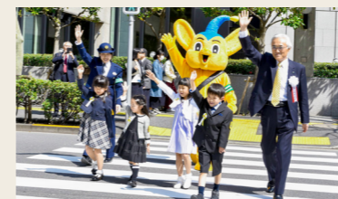
交通安全教室の様子

新入学児童を対象に交通安全キャンペーンの一環として「黄色いワッペン」の贈呈事業に参画しています。