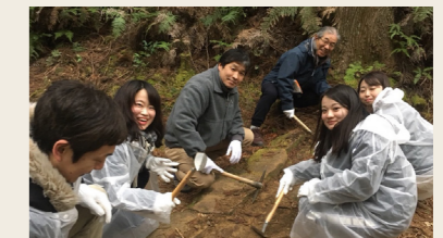
従業員が行なった熊野古道「道普請」によるボランティア活動の様子