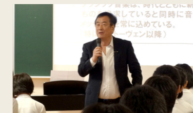
未来を奏でる教室の様子