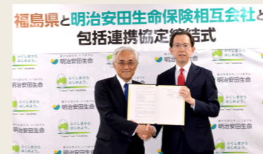
福島県との「包括連携協定」締結の様子

地方自治体や地方金融機関等と地方創生に関する連携協定を締結し、地域社会の貢献活動に取り組んでいます。