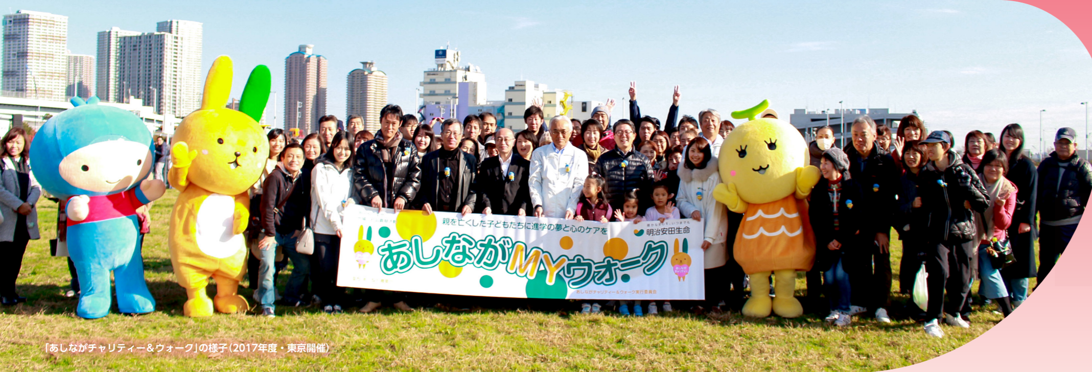
「あしながチャリティー&ウォーク」の様子(2017年度・東京開催)