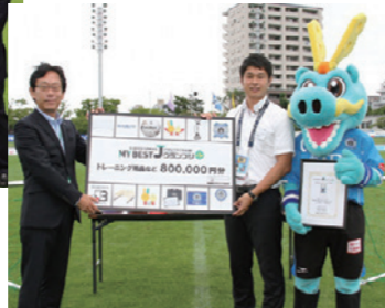
贈呈式の様子(明治安田生命J3)